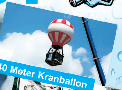
40 Meter Kranballon