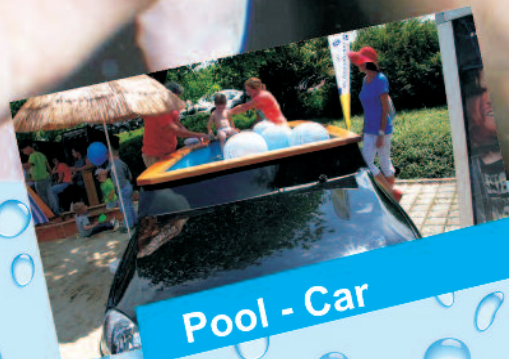
Pool - Car