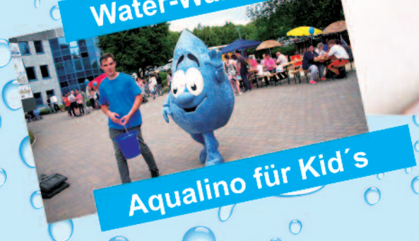
Aqualino für Kid's