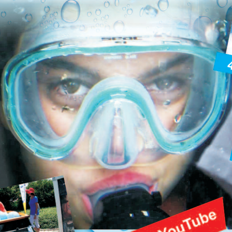
Video auf YouTube Kanal: www.youtube.com/wasserwerkenet