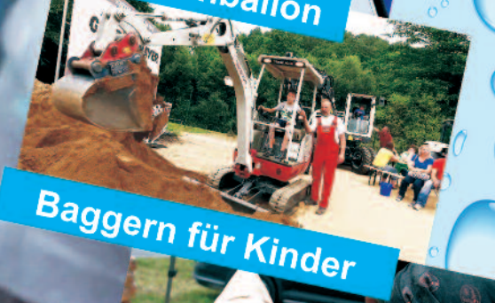
Baggern für Kinder