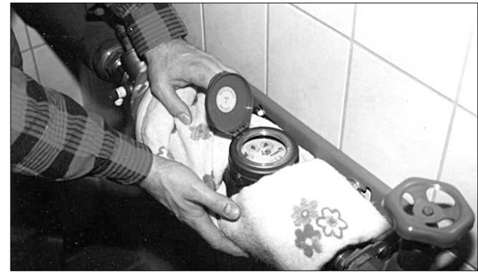
Bei Wintereinbruch müssen gefährdete Hausanschlüsse und Wasserzähler vor Frost geschützt werden.

Achtung, es ist Winter! Nach einigen milden Wintertagen wird es jetzt kalt. Damit sieht man nicht nur weniger Baustellen auf der Straße, sondern es gilt auch, bestimmte Vorkehrungen gerade im Bereich der Trinkwasserhausanschlüsse und Hausinstallationen zu treffen. Die Wasserwerke Westertgebirge möchte daher seine Abnehmer bitten, alle gefährdeten Anschlussleitungen auf Frostsicherheit zu überprüfen und gegebenenfalls zusätzliche Maßnahmen zur Isolierung durchzuführen. Besonders problematisch sind leerstehende Häuser und Wohnungen, Gartengrundstücke, Bachquerungen an Brücken, Zählerschächte oder noch nicht zu Ende geführte Baumaßnahmen am Haus, zum Beispiel bei Trockenlegungsarbeiten der Hausmauern. Aber auch ein in der Nacht offenes stehendes Kellerfenster oder ein in einem Schacht nicht vor Frost gesicherter Wasserzähler kann schon bei geringen Minusgraden zu Einfrierungen und Beschädigungen der Anlagen führen. Einfrierungen kündigen sich meist durch Trübungen und eine geringere Wasserspense an den Zapfstellen an. Dann ist höchste Eile geboten.